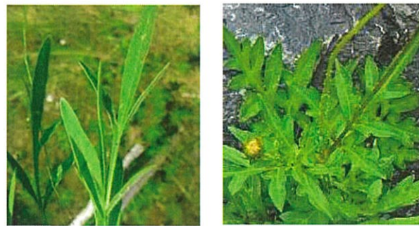
葉の形状が大きく違います