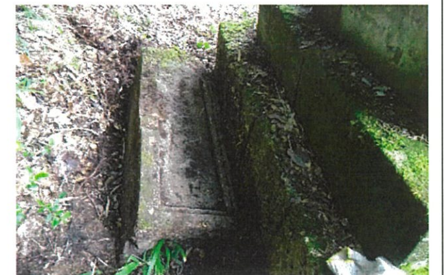
処分されずに残っている4番目とされた井戸公碑

大正時代に立て替えられた今の頌徳碑の後ろ側に、横倒しで落ち葉に埋まっている古い石碑が見つかり、これが4箇所目の石碑と考えられていたようです。