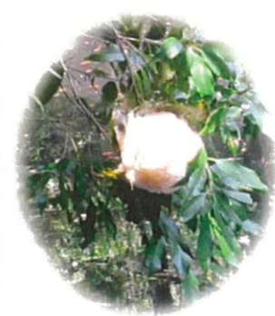
産み付けられた卵塊