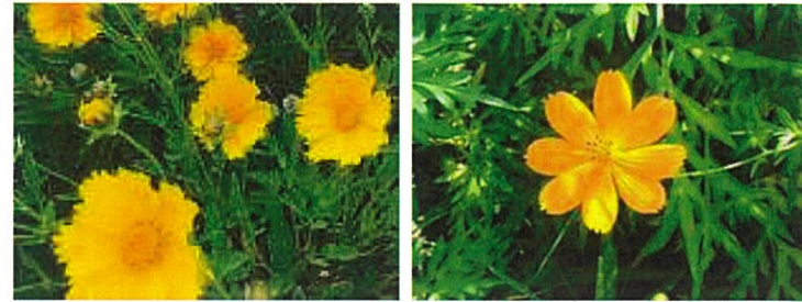
オオキンケイギクの花