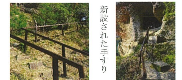
新設された手すり