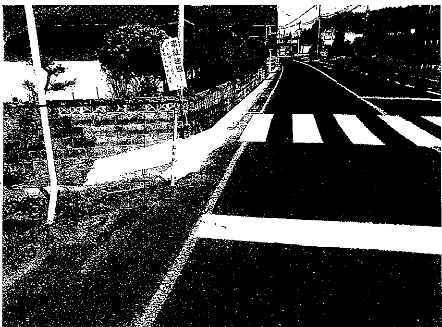
かわいみまもりたい 川合町安全連絡協議会

国道375号の、川合町吉永下の土江さん宅前で上り車線側の側溝が深く危険な状態でしたが、先月末から側溝の幅を狭める改良工事が行なわれて約30mは狭くなりました。ここは、大田第一中学校の中学生や高校生が自転車通学する場所です。この度の改良工事で多少は安全が確保されたと思えます。改良されたとは云え、完全に危険が排除されてはいません。注意して通行しましょう。