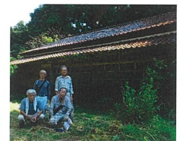
住居跡の草刈り作業