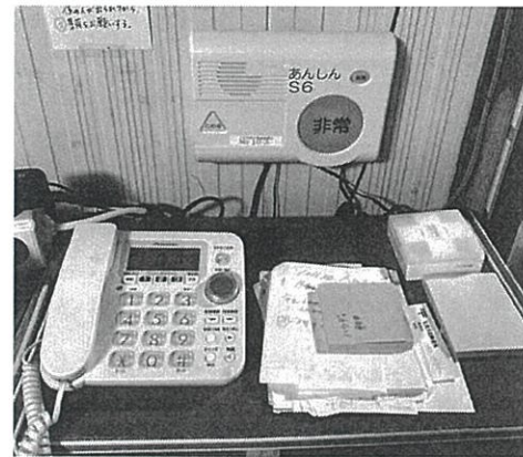
設置された見守りキット