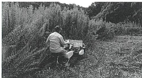
乗用草刈り機による セイタカアワダチソウの除草作業