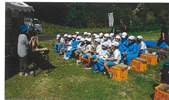
鬼の一夜城伝説紙芝居

最終日の25日は石像を鬼岩前に設置し、台座には手形が貼り付けられ、「鬼岩の願い像」が完成しました。会場準備や運営、片付けなどには多くの町民の方や関係者の皆さんが協力をされ、大屋町民の絆、地域の力を感じた催しとなりました。