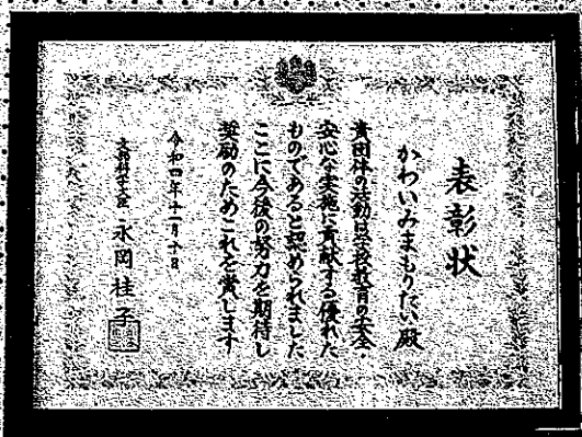
かわいみまもりたい

かわいみまもりたい表彰受賞 11月10日（木）岩手県盛岡市で、「令和4年度全国学校保健・安全研究大会」が開催されました。この席上で、かわいみまもりたいが『文部科学大臣表彰』を受賞しました。これは、平成20年の「全国防犯連合会表彰」と「平成21年安全・安心なまちづくり関係功労者内閣総理大臣表彰」を受賞して以来の全国表彰です。今回は、学校安全ボランティア団体表彰全国29団体に推薦され、活動している川合町の代表として更には大田市の代表として、かわいみまもりたいが受賞したものです。