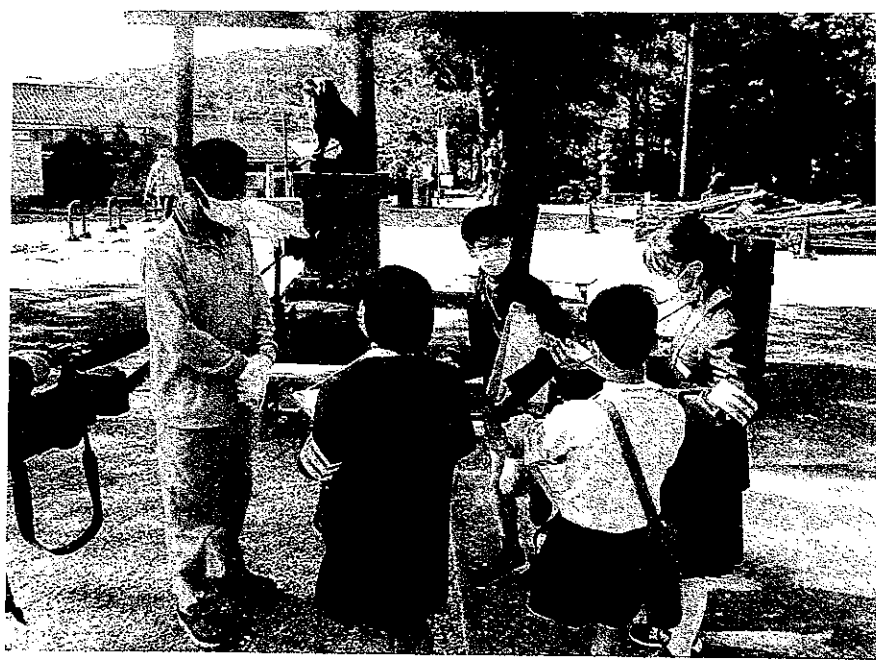
川合小学校 かわいみまもりたい

10月19日(水)午前8時45分から、川合小学校恒例の『地域防犯安全マップづくり』を行いました。当日は、5年生児童8名を2班の4名ずつに編成し、かわいみまもりたい・交通安全協川合支部・警察署と教師が監視と指導に付添いました。始めの会后、物部神社周辺を歩いて学習しました。帰校後は、コメントや写真を貼って安全マップを完成させ、一人一人が感想を発表して地域防犯安全マップづくりを終えました。市内16小学校でも、この活動は川合小学校のみ行っています。