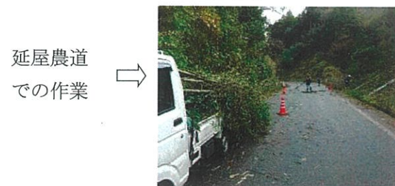
延屋農道での作業