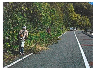
和田農道での作業

は大屋町外ですが、大屋町民が多く利用する幹線道路でもあり、今後とも皆さんの協力をお願い致します。