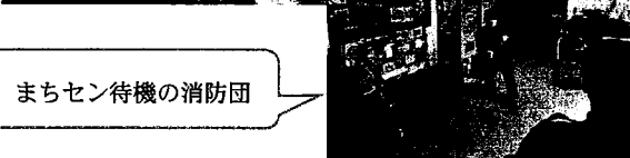
まちセン待機の消防団