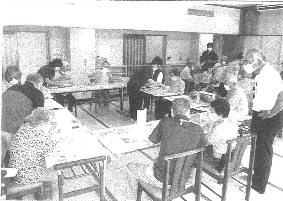
川合まちづくりセンター

7月24日(月)福寿園にて「福寿園・川合ふれあいの集い」を開催し、参加者は福寿園の方々と一緒に木箱作り挑戦しました。帰りにはお土産のお弁当を戴き和やかに帰路につきました。この事業は、福寿園、そして民生児童委員のご協力を得て、年2回開催しております。しかしながら、近年は新型コロナウイルス感染症拡大予防のため中止しており、今年久しぶりの開催に皆さん大変よろこんでおられました。