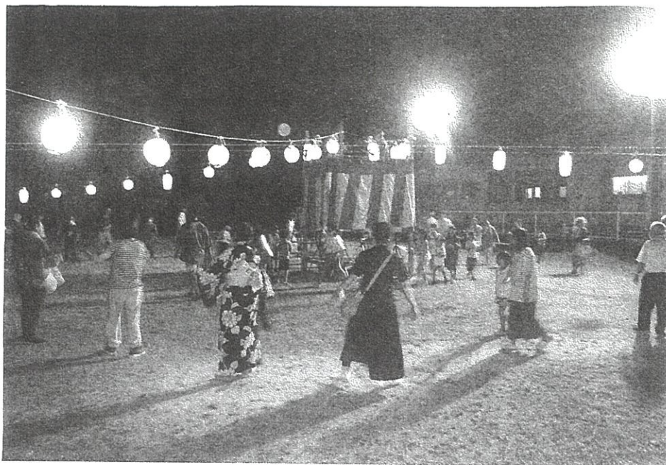
川合町盆踊り保存会