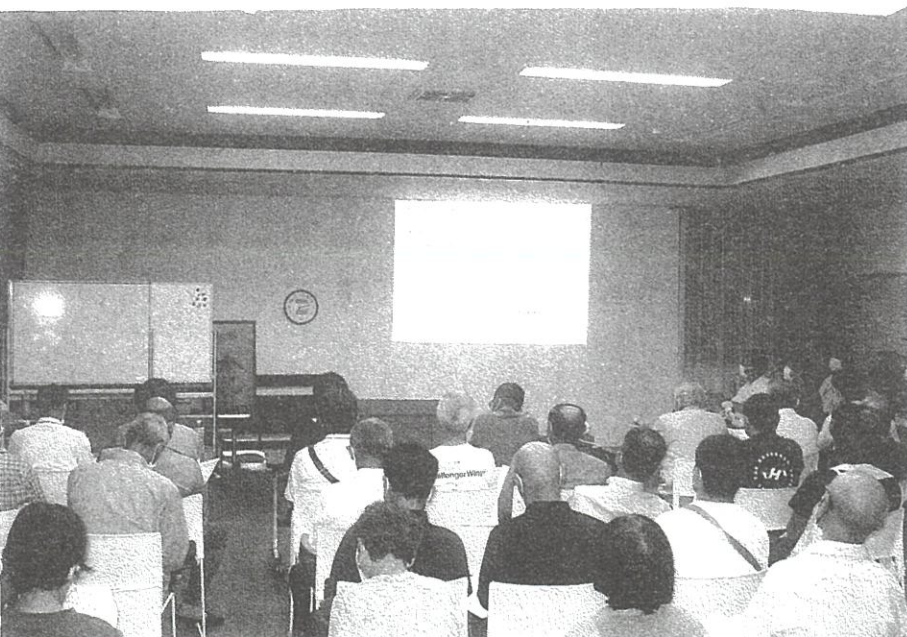
川合町自治会連合会

9月30日(土)午後7時から、大田市役所担当課職員を講師として川合町自治会長会研修会を開催しました。内容は、①政策企画課から、大田市の取得率が70%のマイナンバーカードについて、②農林水産課から、農地の貸借についての2項目に絞って講義を受けました。当日は、自治会長と自治会員約50名余の出席で熱心に聴講しました。会議で事業や計画報告のみならず、初めての試みですがこれも良いかなと思えました。