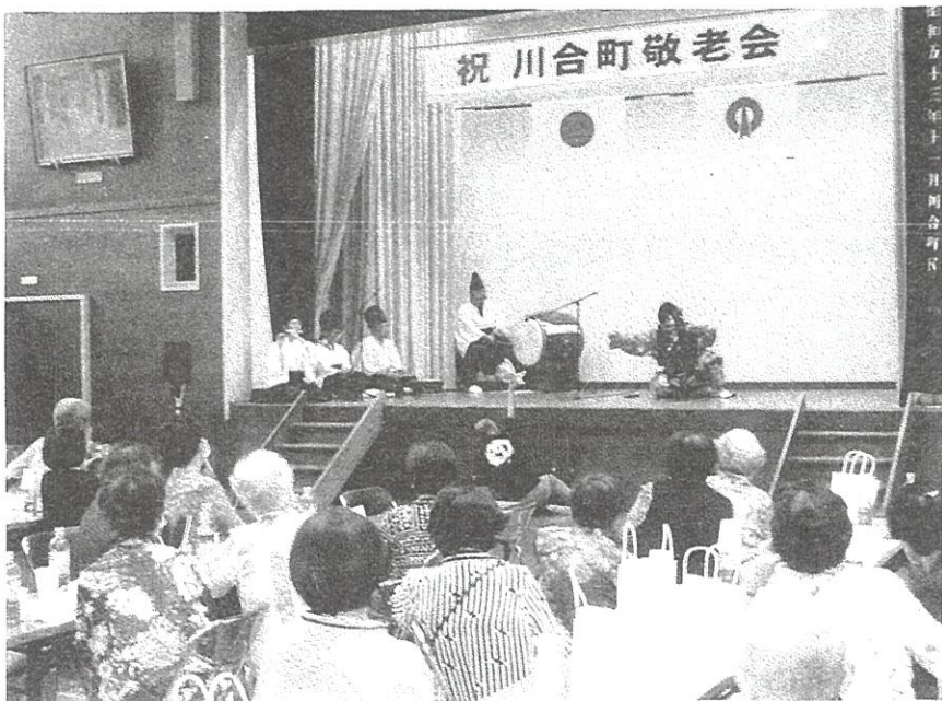
川合地区社会福祉協議会

9月18日(月)、4年ぶりに「川合町敬老会」を川合小学校体育館で開催しました。当日は該当者約70名余が出席して、園児や児童の演技と大正琴や神楽の綱釣りを楽しみました。神楽の最中に、大雨が降りおまけに雷も轟いて賑やかでした。