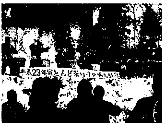
平成23年子ども樽太鼓

これからも冠羽自治会にこだわらず、多くの皆さんと協力しながら続けていけたらいいなあと思っています。