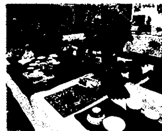
大国文化祭の陶芸作品