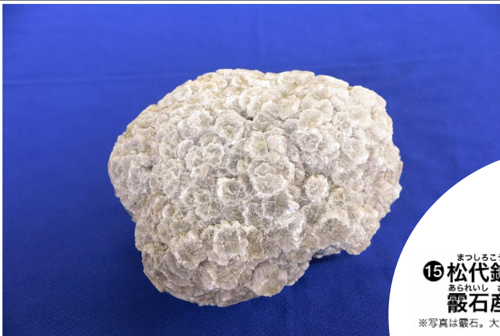
まつしろこうざん 15 松代鉱山の あられいし 産地 霰石産地 ※写真は霰石。大田市所蔵標本