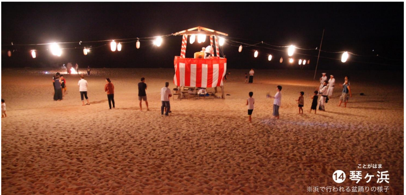
ことがはま 14 琴ヶ浜 ※浜で行われる盆踊りの様子