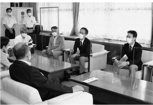
図書購入費を寄附した森脇会長(右)ら