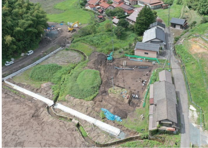
上空から見た池田北遺跡