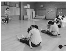
なかよし会 (親子ふれあい遊び)