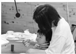
離乳食試食会 (要予約)