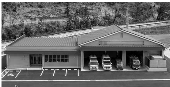
新築した西部消防署庁舎