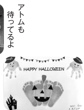
「作ってあそぼうコーナー」 手形足形アートも人気です