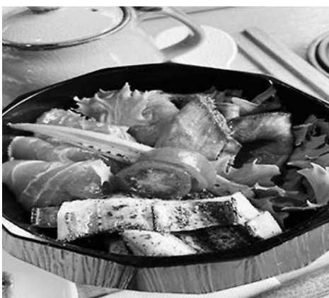
三瓶サーモン、三瓶放牧牛、大田の大あなごの「ぜいたくひつまぶし」

三瓶山西の原にある「山の駅さんべ」では、三瓶の雄大な景色を眺めながら、大田の食材をふんだんに使った、まさに地産地消の食事を楽しむことができます。