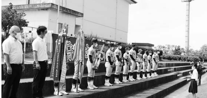
生徒代表のあいさつ

選手がメダルを首にかけ、優勝旗や優勝カップなどを持ち入場すると、約200人が拍手で迎えました。