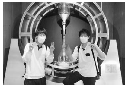
「映えスポット」もあるよ