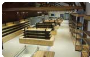
7 特産品販売コーナー