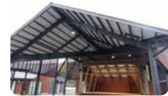
11 屋根付きイベント棟