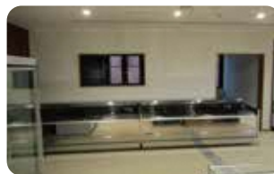
8 鮮魚販売コーナー