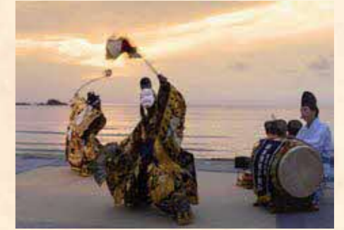
「夕日の舞」福光海岸