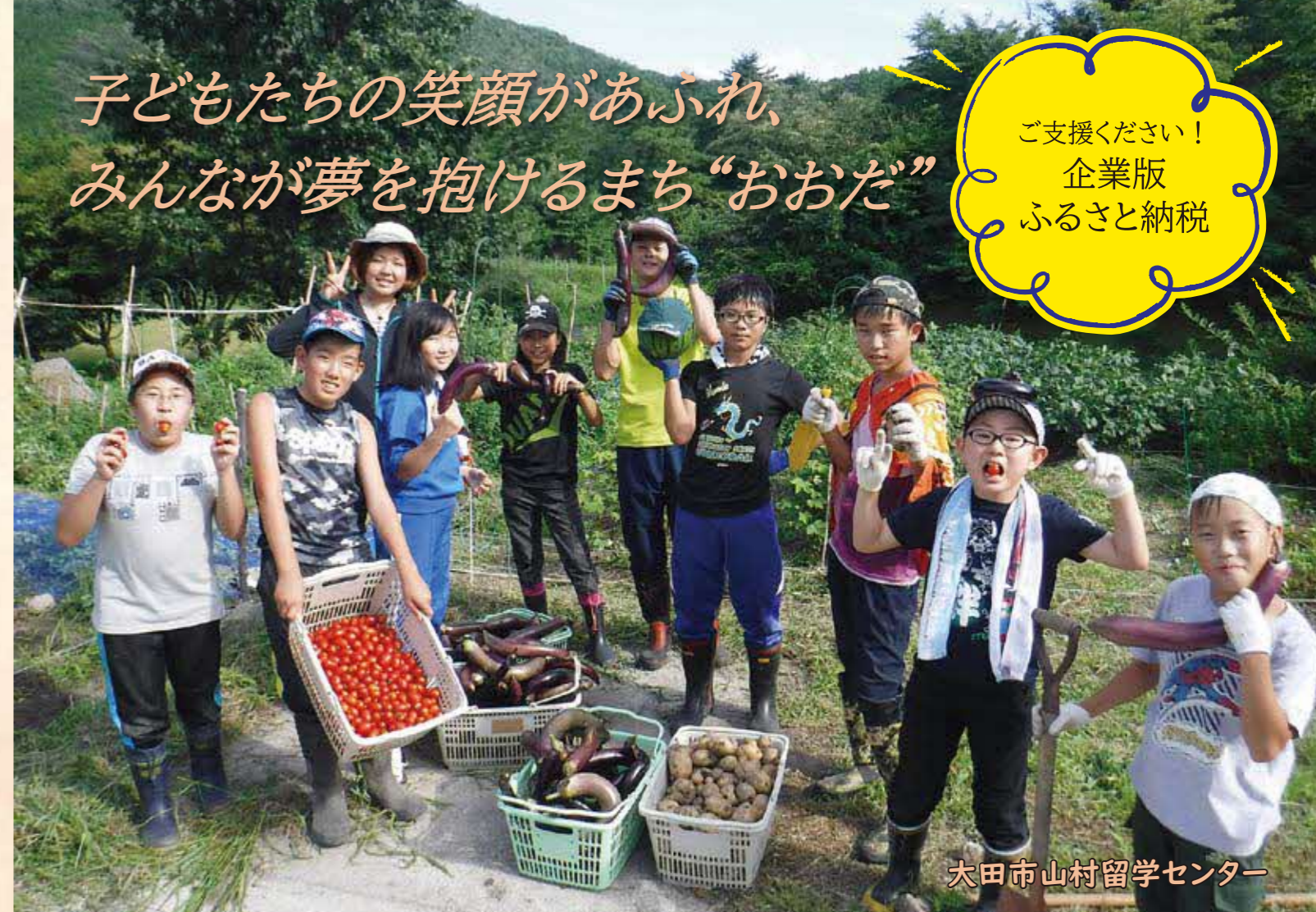
大田市山村留学センター