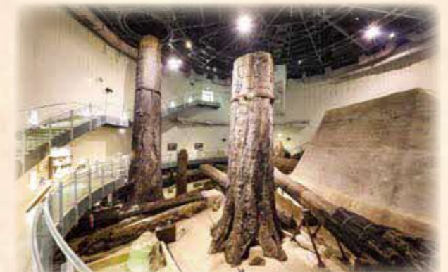
日本遺産「石見の火山が伝える悠久の歴史」