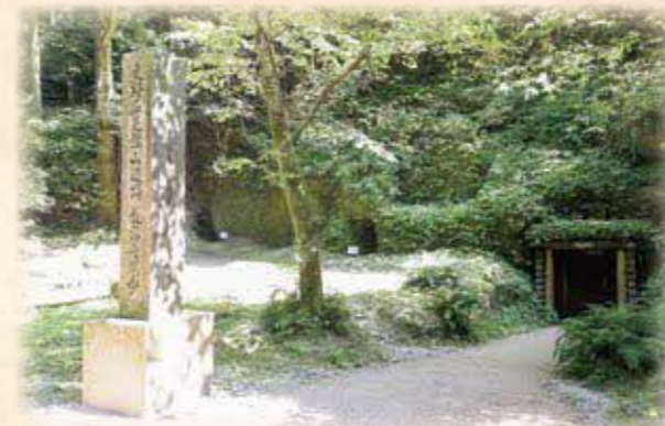
世界遺産「石見銀山遺跡とその文化的景観」