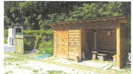
左がトイレ 右が休憩所

『鬼岩公園』に地元の強い要望に応え、大田市日本遺産協議会によって、バイオトイレが設置されました。水を使わないでオガクズを利用した環境にやさしいトイレです。これに併せ鬼岩や笹川周辺の四季折々の情景をゆっくりと楽しんでいただくため、住民手作りの休憩所も建設されました。