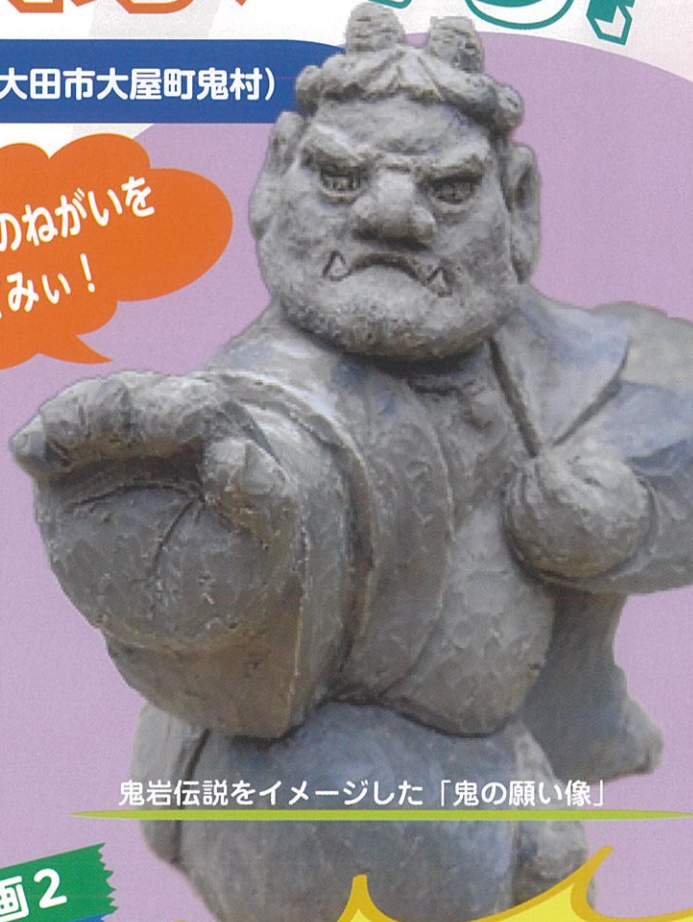
鬼岩伝説をイメージした「鬼の願い像」