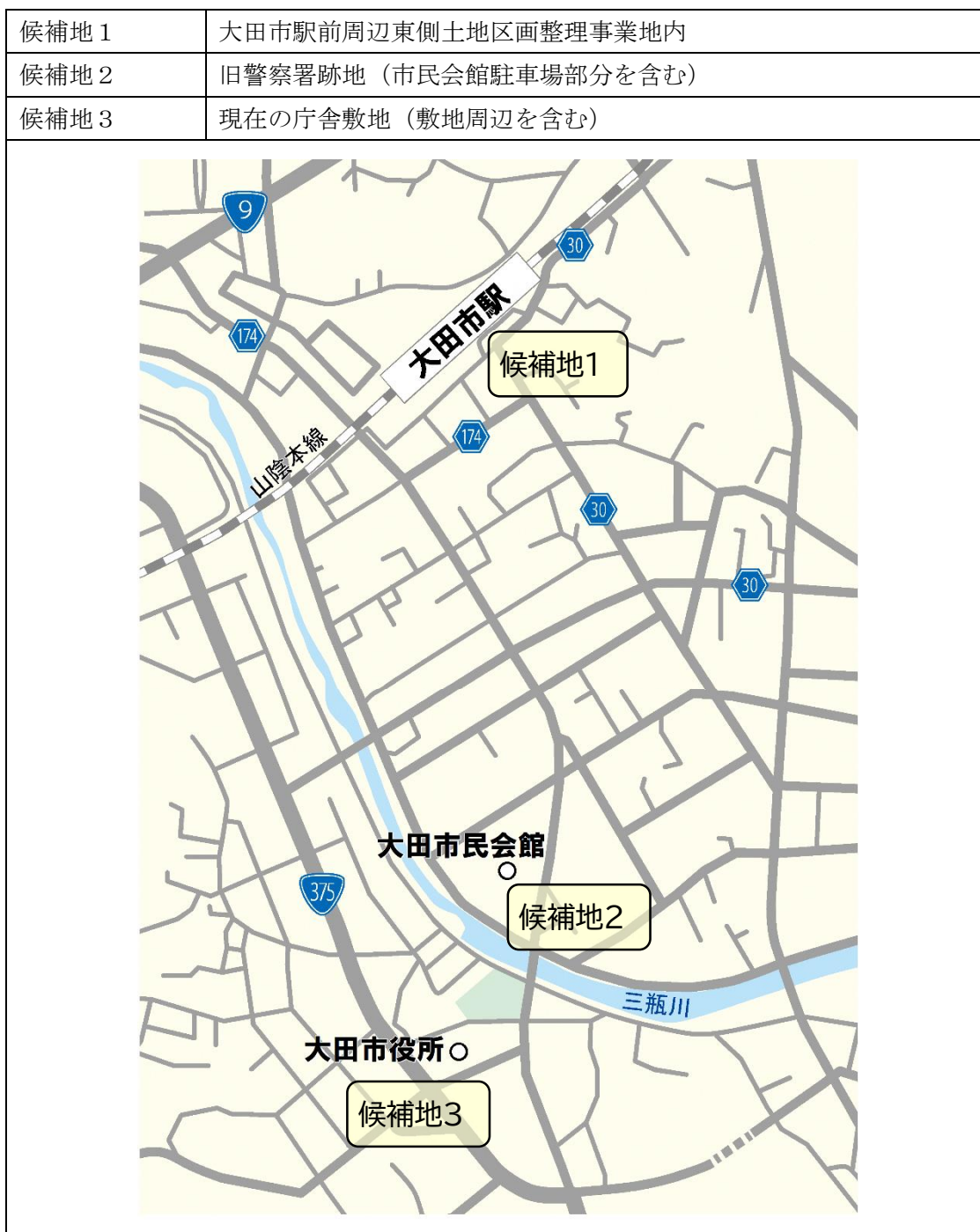
図 建設候補地の位置

建設候補地は、大田市立地適正化計画における都市機能誘導区域内の市有地であること、事業の実現性があること、地域経済との連携が可能であること等を主な条件として以下の3カ所を抽出しました。