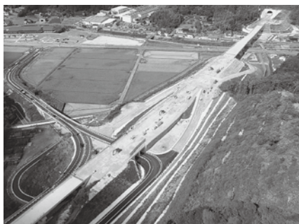
静間・仁摩道路 (仁摩・石見銀山IC付近)