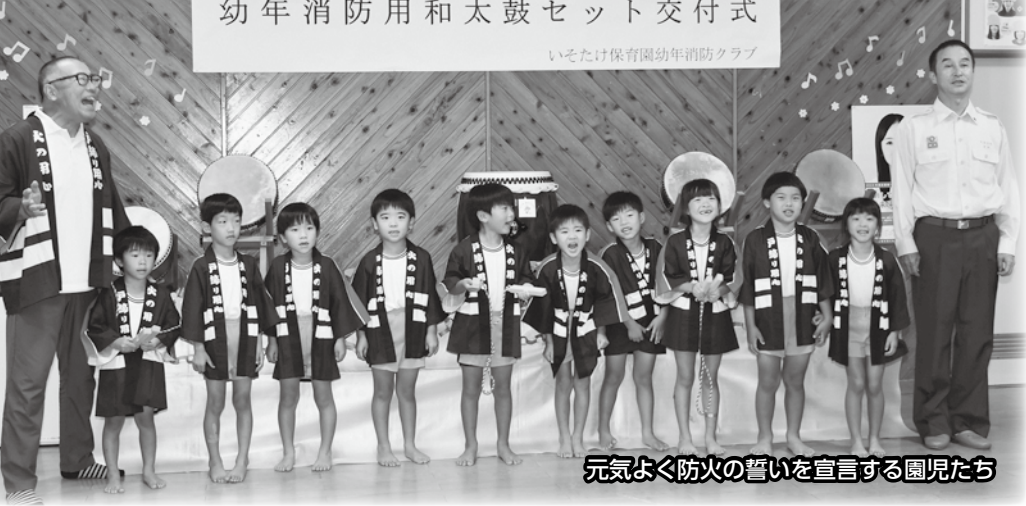
元気よく防火の誓いを宣言する園児たち