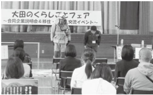
自社の魅力を紹介する担当者

体育館でおこなわれた企業PRタイムでは、市内の建設業や医療福祉などの17企業が自社の仕事内容や特色を紹介し、それぞれの魅力をアピールしました。