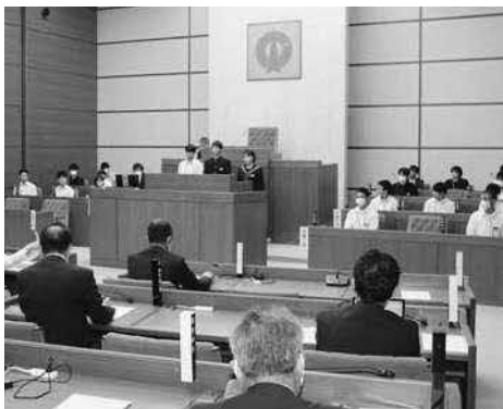
議場で各校の取り組みなどを発表しました