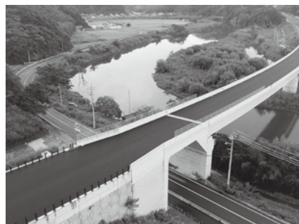
大田・静間道路 (静間川橋(仮称)付近)