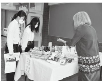
市内飲食店が販売する商品を選ぶ来場者

市内企業17社が各教室に分かれて、自社の情報や求める人材などについて説明するとともに、体験ブースを設けて参加者に仕事を体験してもらうなど、大田で働くことをイメージしてもらいました。また、ハローワーク石見大田の出張相談窓口を設け、市内の企業情報を紹介しました。