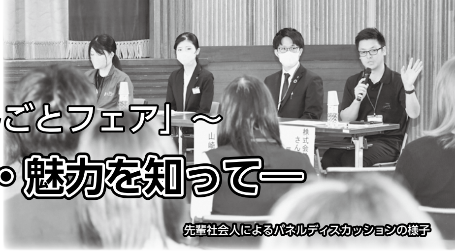
先輩社会人によるパネルディスカッションの様子