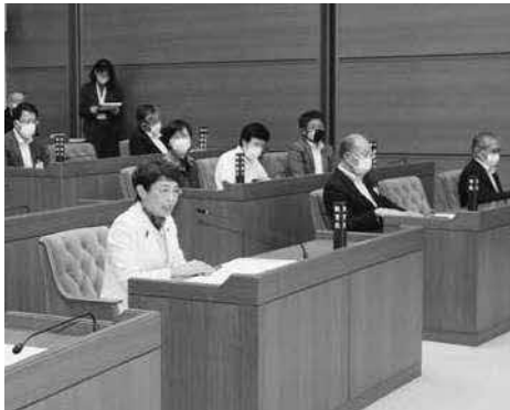
司会進行をおこなう教育長

教育長は「生徒会はみんなの手で学校を居心地良くする活動。今日は大変貴重な意見交換だった」と話しました。