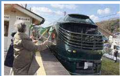
JR温泉津駅での歓迎の様子

JR西日本は、豪華寝台列車「トワイライトエクスプレス瑞風」の山陰上りコースの新たな立ち寄り観光地を、2024年秋から石見銀山に決定し、10月12日に大田市役所で決定通知式をおこないました。 歓迎のおもてなしを6年間続けて—