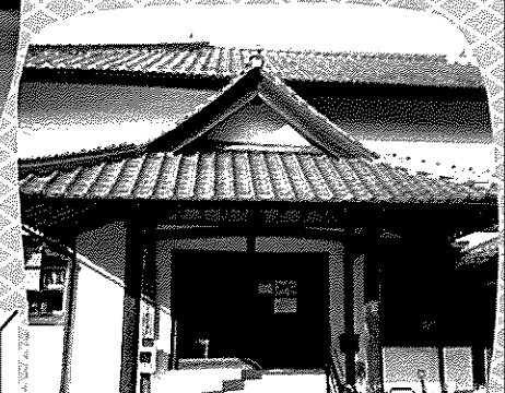
大森町並み交流センター