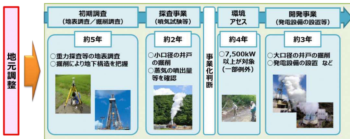
図 地熱発電事業の一般的な開発プロセス

※環境影響評価法（平成9年法律第81号）に基づく環境アセスメント手続については、前倒環境調査を適切に実施した場合には、短縮が見込まれている。また、井戸の掘削期間の短縮化に向けた技術開発なども行われている。