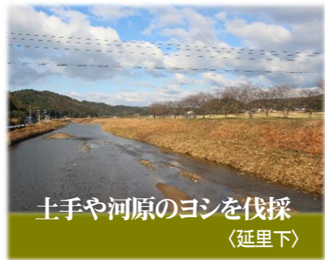
土手や河原のヨシを伐採 (延里下)

延里下地区を流れる静間川。この土手や河原、延長約600mに生い茂っていたヨシが昨年度に続き、今年度も伐採されました。