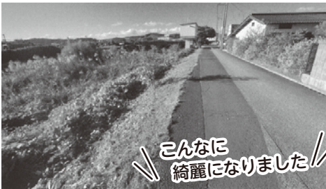
こんなに綺麗になりました！