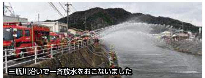
三瓶川沿いで一斉放水をおこないました

△表彰された企業（順不同・敬称略） 株式会社山崎組(鳥井町)・稗田産業有限会社(久利町)