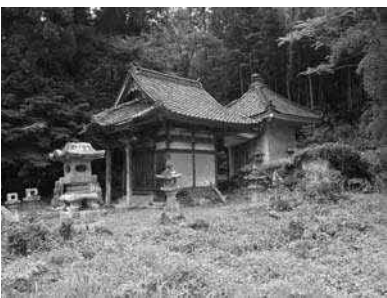
修理事業前の豊栄神社

18(1943)年の水害による被害が大きく、倒壊の恐れがあるほど傷んでいました。 発掘調査は、修理に必要な基礎資料を得るため、境内地の造成状況や、本来の排水施設の確認を主な目的としておこなわれました。 発掘調査の結果、境内全体に昭和18年水害の影響が及んでいたことが判明しました。水害後の復旧は限定的で、参道以外には流入した土砂が多く残されていました。豊栄神社の参道は、今でも周囲が高くなっていますが、これは本来の地形ではなく、水害の痕跡でした。土砂の中には倒れた玉垣や石造物の破片も残っており、災害と当時の復旧の実態を今に伝えています。 個別の調査成果については、改めてご紹介します。