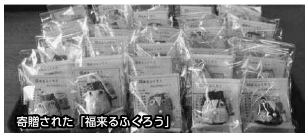
寄贈された「福来るふくろう」

寄贈された「福来るふくろう」は、10歳を迎える児童の健やかな成長を祈念して会員が手作りのもので、市内の小学校4年生全員を対象に贈られます。