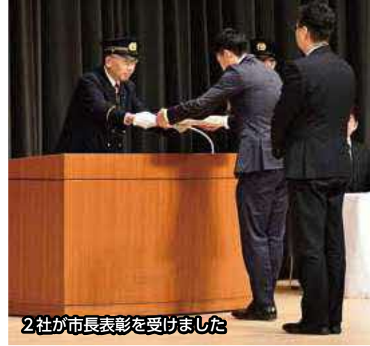
2社が市長表彰を受けました

式典終了後、約40台の車両と消防団員らが分列行進をおこない、三瓶川沿いで一斉放水をしました。