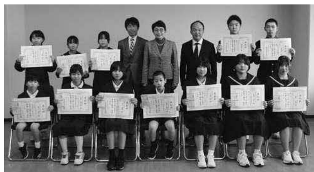
受賞された皆さんと関係者