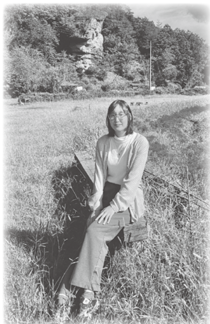
おにむら おにいわ ぱっく 鬼村の鬼岩をバックに

こくさいこうりゅういん ねんかん ふ かえ ～国際交流員としての4年間を振り返って～