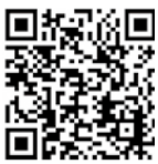
大田市議会 YouTube 公式チャンネル

大田市議会では、大田市議会YouTube公式チャンネルや大田市公式LINEにて、市議会に関する情報を発信しています。 登録をお願いします。