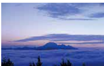
▲仙ノ山からみた三瓶山

③ 県や団体と協力し外来種駆除と水位確認を継続し、水位回復や環境保全を関係機関と連携して進める。