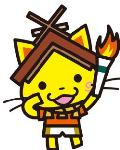
マスコット「しまねっこ」