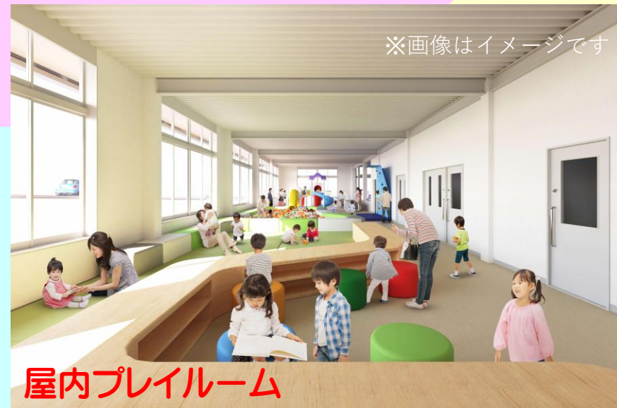
屋内プレイルーム